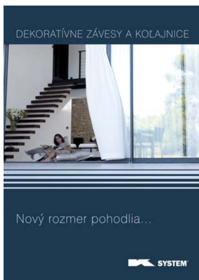
Dekoratívne závesy a koľajnice