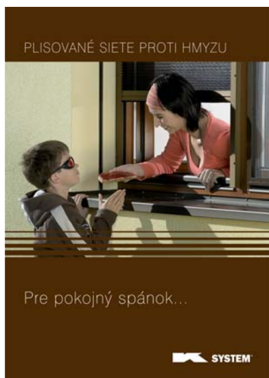
Plisované siete proti hmyzu